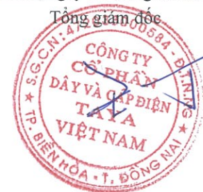
WANG TING SHU